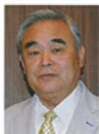
第2副地区ガバナー