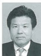
1R2Z GMT:GLT委員 指導力育成(GLT)委員長