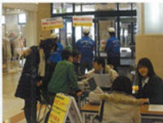
献血運動(ファボーレ)