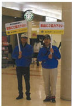
献血運動(ファボーレ)

今、夢にも思っておりませんでした第2副地区ガバナーという大役を拝命することとなり、役職の大きさと責任の重さに身の引き締まる思いであります。かかる大役を果たすため、私自身ライオンズマンとして、また人として豊かな心身を培い、努力していく所存であります。力及ばない点も多々あると思っておりますので、役員、会員諸兄のご指導、ご協力を宜しくお願い申し上げます。