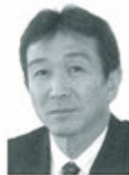
ライオンテーマー (副幹事)