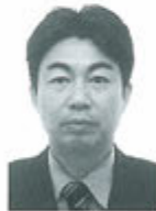
次期会計 接待・XS委員長