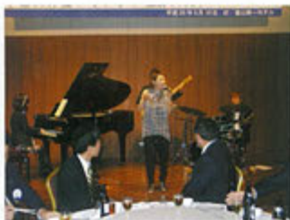
富山神通LCCN44周年記念例会