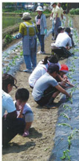
富山視覚支援学校生徒さつま芋苗植え