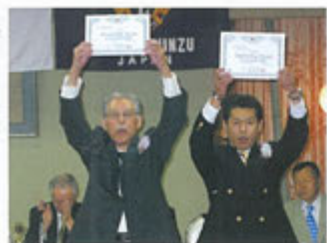
No.1070 年次例会〔夜間例会〕