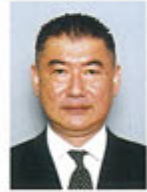
1R2Z PRライオンズ 情報委員長