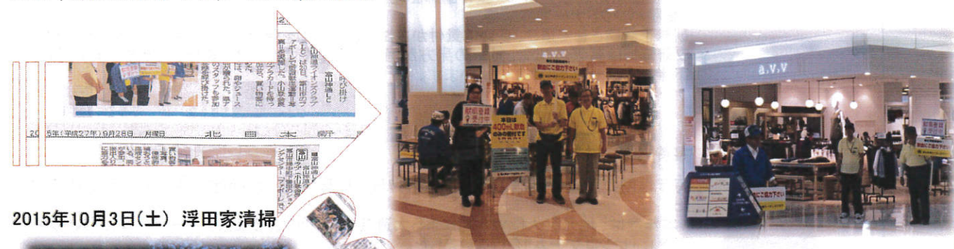
2015年10月3日(土) 浮田家清掃