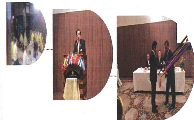
2015年12月17日(木) クリスマスパーティ