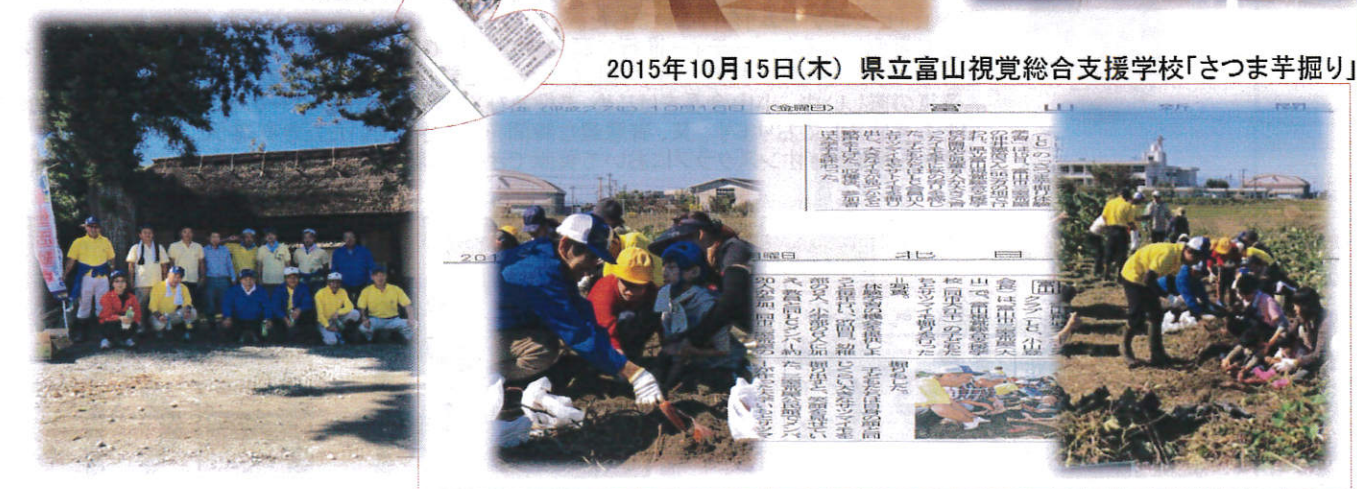
2015年10月15日(木) 県立富山視覚総合支援学校「さつま芋掘り」