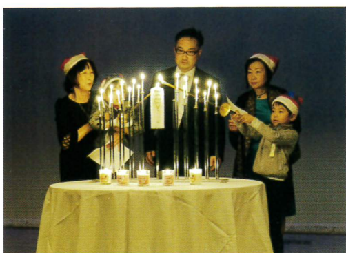
12月 クリスマス家族例会