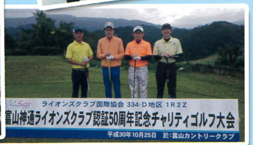
ライオンズクラブ国際協会 334-D 地区 1R2Z 富山神通ライオンズクラブ認証50周年記念チャリティゴルフ大会 平成30年10月25日 於:富山カントリークラブ