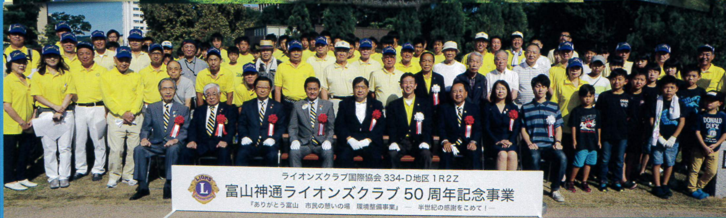
ライオンズクラブ国際協会 334-D 地区 1R2Z 富山神通ライオンズクラブ 50周年記念事業 『ありがとう富山 市民の集いの場 環境整備事業』 — 半世紀の感謝をこめて —