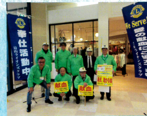
1月献血運動(ファボーレ)