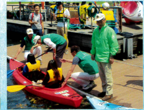
5月ルンビニ園児とのカヌー体験教室