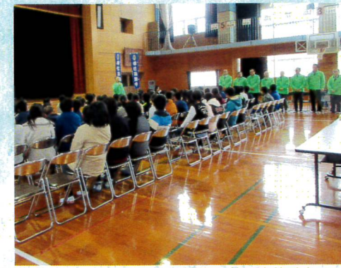
11月堀川小学校での薬物乱用防止教室