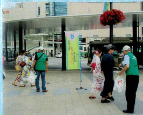
8月富山駅での薬物乱用防止キャンペーン