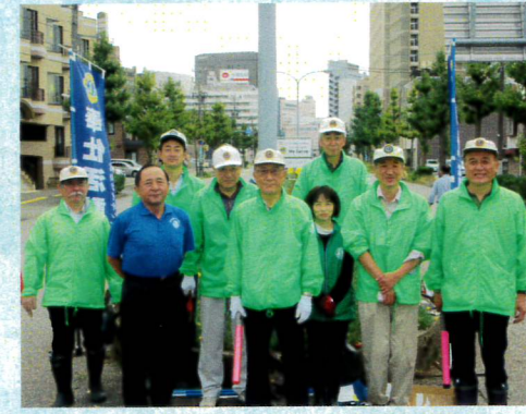
10月ライオンズデー花壇整備