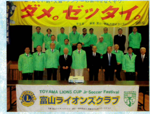
11月富山ライオンズカップでの薬物乱用防止講座