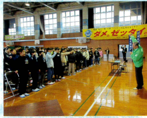
11月藤の木小学校での薬物乱用防止教室