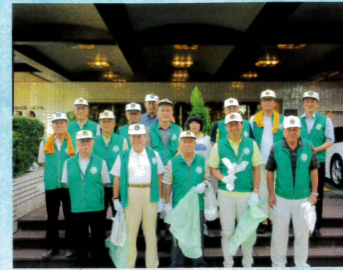
8月ふるさと富山美化大作戦