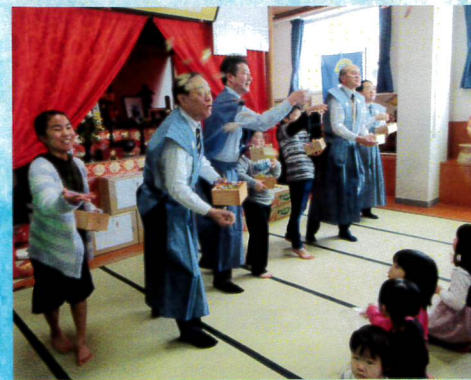
1月ルンビニ園での節分の集い