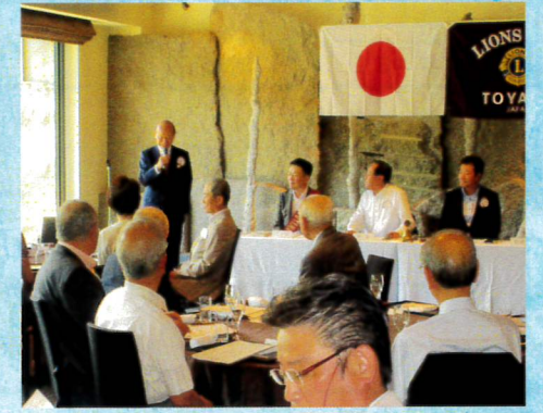
9月CN61周年記念大会にて石井知事のご挨拶