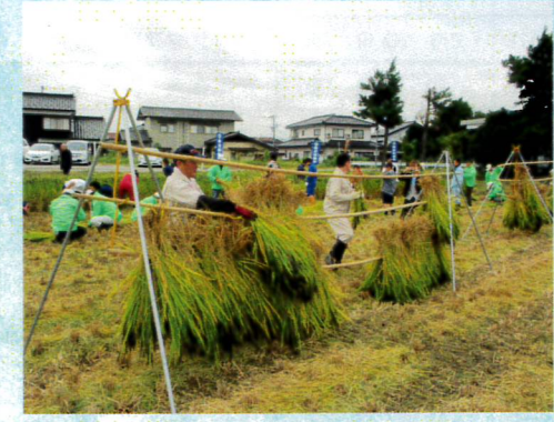
10月ルンビニ園時との稲刈り