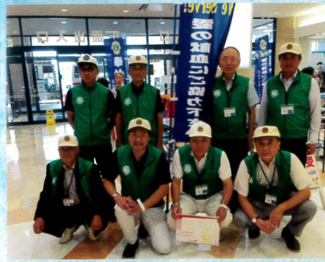
9月献血運動(ファボーレ)