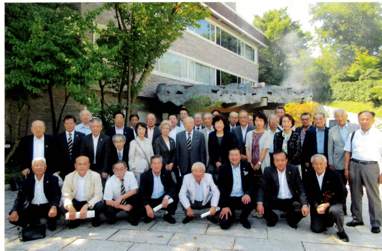
2017年9月9日(土) CN61周年記念大会 富山市 リバーリトリート雅楽俱